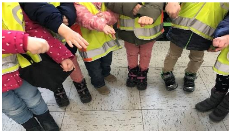
Den Fridolinstempel gibt es zum Schluss...

Alle Beteiligten und Zuhörer erlebten im sehr gut gefüllten Probst-Gerhard-Saal neben der katholischen Kirche in Oberpleis einen insgesamt rundum gelungenen Abend, der alle bereichert nach Hause gehen ließ.